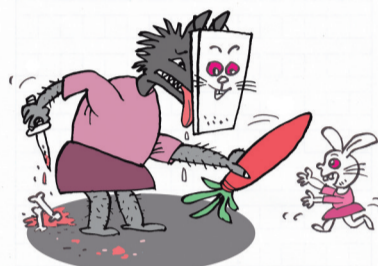
▲上当不是因为别人太狡猾,而是因为自己太贪心。