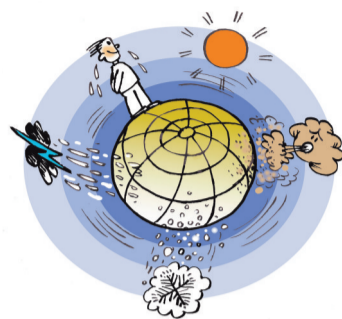
▲一个人不会永远处在倒霉的位置,因为地球是运动的。