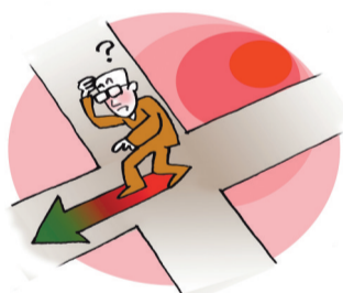
▲人生道路并不会一帆风顺,当你陷入迷茫时,请相信你的背后还有阳光。