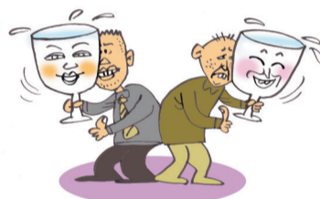
▲在酒宴上,主角不是酒杯,而是那些面具。