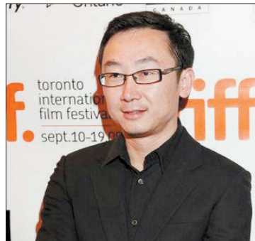
导演陆川(资料图片)

今年春节期间,陆川去了好莱坞,思考下一部电影应该为观众拍什么,怎么拍。他认为,目前中国观众需要的电影语言是叙事性的,而不希望在语言上有太多挑战。“因为他们是电视剧和美国大片培养起来的一批观众,无法接受