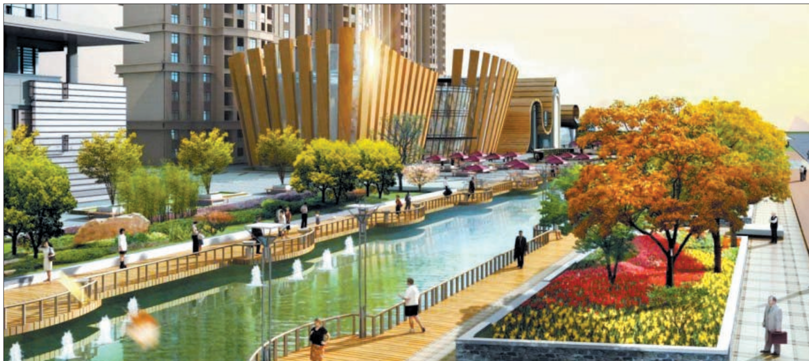
开元大道东段南侧水系效果图