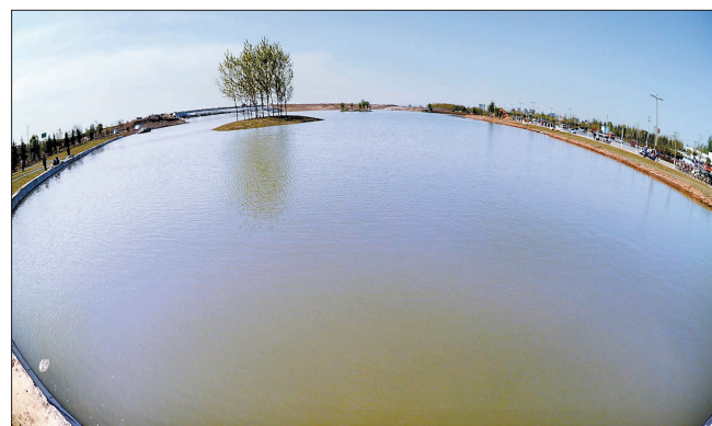
蓝天白云下的“e岛”水系

同时,龙门大道以西湖面的北侧和西侧建有亲水平台;在湖周边的绿化带内,还将铺设约1米宽的道路。