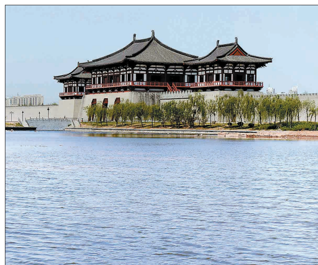
碧波荡漾的定鼎湖