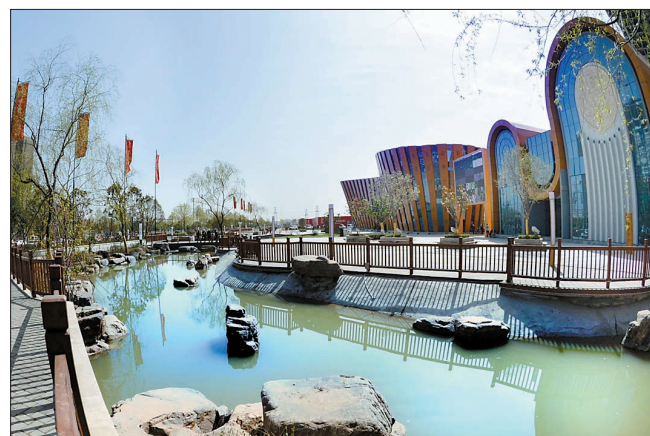
开元大道东段南侧水系掠影