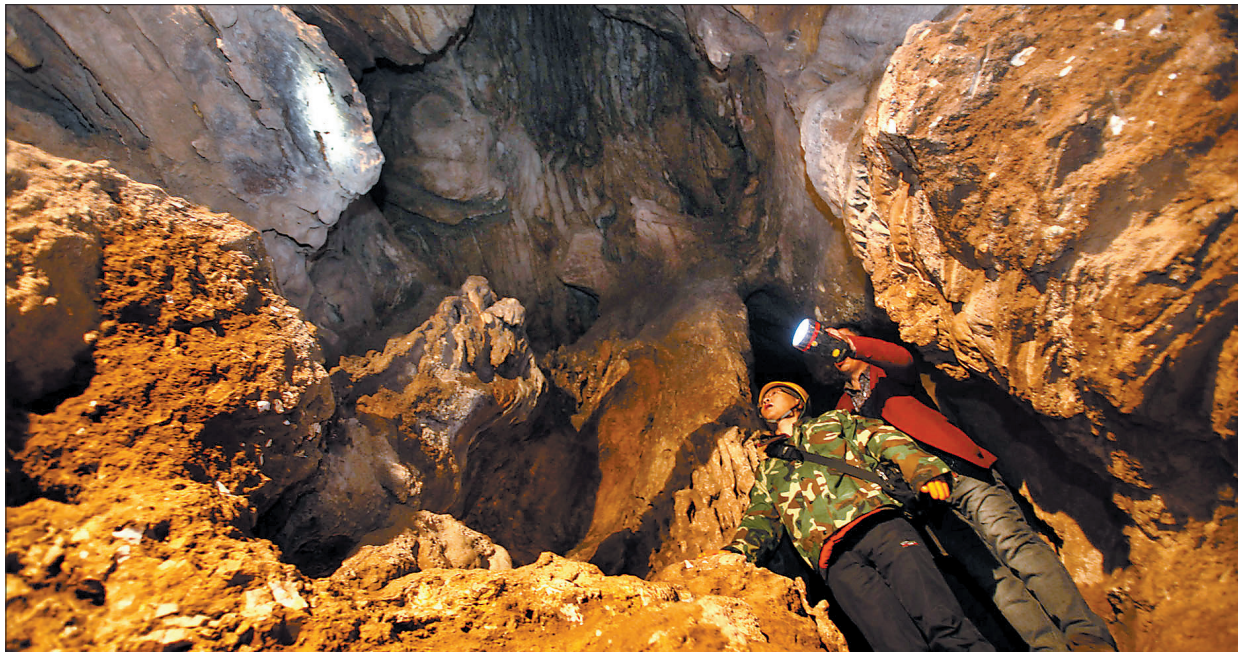
孙家洞遗址中还有什么?我们共同期待着

昨日上午,2012年度全国十大考古新发现名单在北京正式揭晓,由市文物考古研究院和栾川县文化广电新闻出版局共同发掘的栾川孙家洞旧石器遗址榜上有名。这是我市第八个入选全国十大考古新发现的项目。此前,该项目还入选2012年度河南省五大考古新发现。