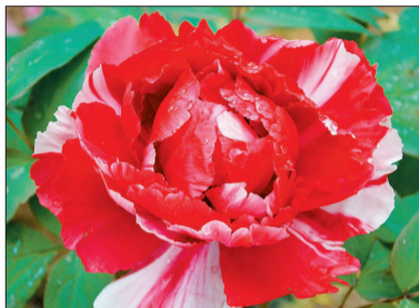
《晨露润月》(王女士拍于国家牡丹园)