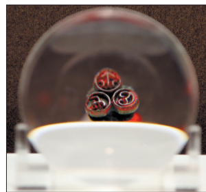
“内心介”亭钮铜印(战国)