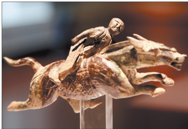
褐绿釉骑马俑(汉代)

11日上午,洛阳博物馆第四届民间文物收藏展在洛阳博物馆二楼的临时展厅开幕,200多件从战国到明清时期的各式带钩精彩亮相,许多罕见的印章、陶俑等也一并展出。这些精美藏品均为我市一名民间收藏家多年收藏。