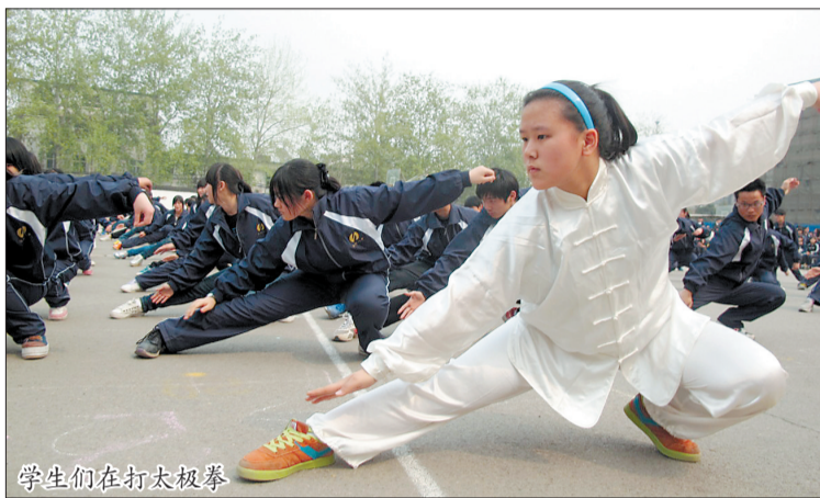
学生们在打太极拳

广播体操太老套、枯燥，提不起兴趣？来看看吧，在上午的大课间，市第八中学的师生们有自己的“法宝”。