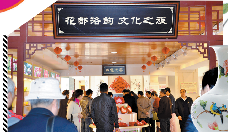
万景祥国色天香牡丹化妆品专区

参与最受欢迎“洛阳礼”活动，让您的企业和旅游商品走出洛阳、走向世界，让世界惊叹洛阳的创新、洛阳的发展。三彩艺、洛阳牡丹红茶、唐三彩、青铜器、牡丹瓷、牡丹画、牡丹化妆品……“洛阳礼”，传天下！“洛阳礼”活动参与热线：65233721 13838868975 13598175653