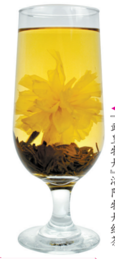
武皇牡丹 洛阳牡丹红茶