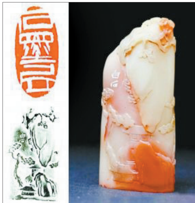
齐白石刻芙蓉石“石墨居”扁章