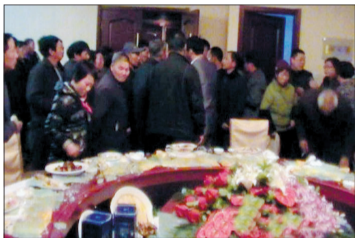
当地居民进入官员宴会现场“搅局”