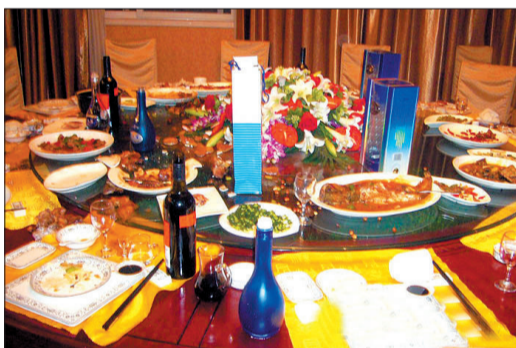
饭桌上官员享用过后的高档烟酒“残骸”