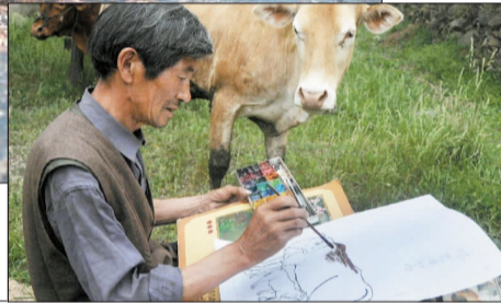
《雨中“白领哥”纯爷们儿》组图之一