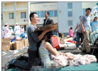
4月20日,在芦山县人民医院,一位丈夫跪地给受伤的妻子遮阳。