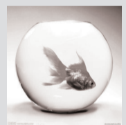
图1：倒进染发剂鱼缸的鱼已经全死了，化学染发剂太可怕了！

图2：倒进印度【玖玖海娜花】鱼缸里的鱼还在自由自在地游，还活蹦乱跳呢！证明天然无副作用。