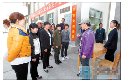
为省门票, 一男子一下子带去五个“妈”