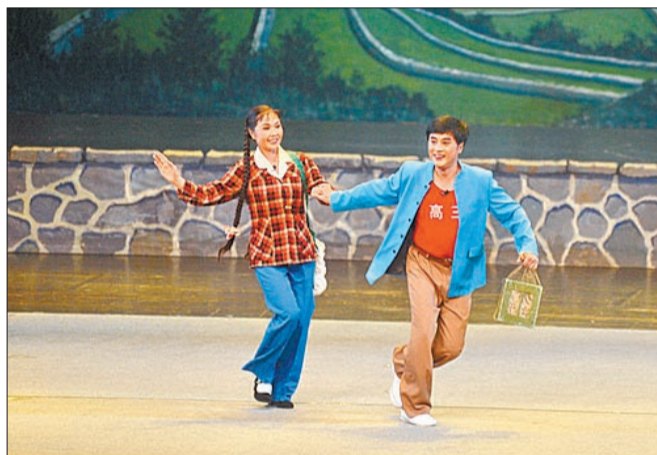
《朝阳沟》在洛阳歌剧院的演出现场