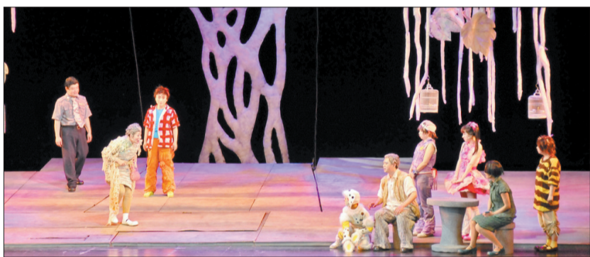
《宝贝儿》连演16年仍大受欢迎,不断吸收时尚元素是关键