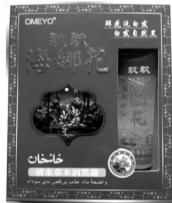
请认准正宗玖玖海娜花注册商标