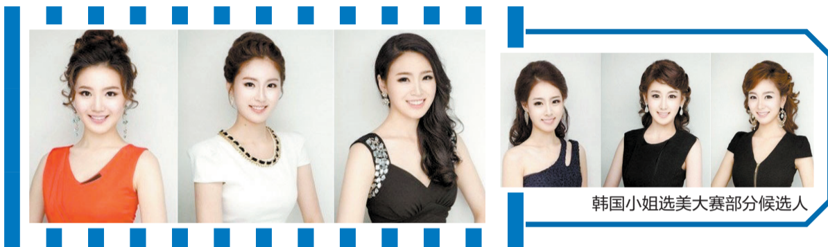
韩国小姐选美大赛部分候选人