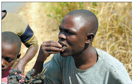
一名男子正在吃鼠肉