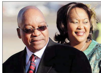
2010年3月2日,南非总统雅各布·祖马与玛蒂芭乘坐的飞机降落在伦敦西斯罗机场

元)的钻石,其中包括一枚钻石臂章、两副钻石耳环、手镯、项链和坠饰,以及两枚钻石戒指和一枚蛇形黄金钻石戒指。