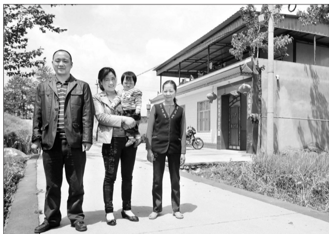
2011年5月2日,有了小女儿、盖了新房的他们对生活充满希望