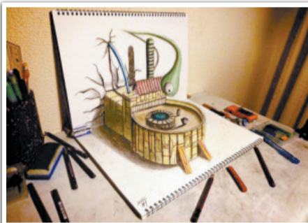
@sweet三味书屋:真不敢相信,这居然是用铅笔创作的3D立体画……