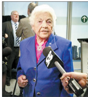
11次连任的黑兹尔·麦考莲

九旬老妇不但能开车，会钓鱼，甚至可以当市长，并且创造11次连任的记录，这便是全球最年长女市长、加拿大密西沙加市市长黑兹尔·麦考莲。