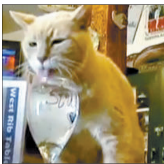
这只猫咪一般在综合商店“办公”