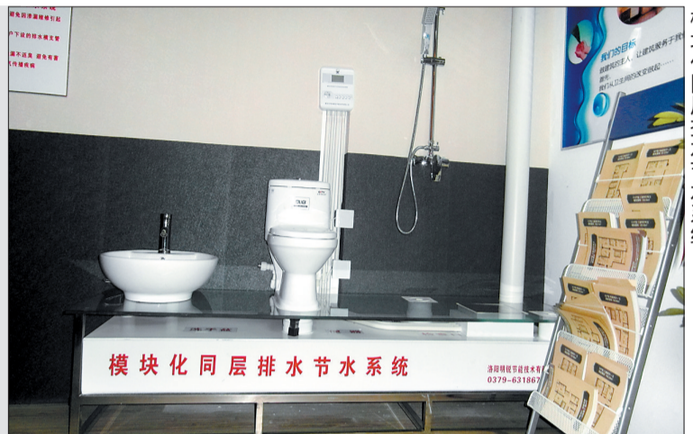
模块化同层排水节水系统

该公司依靠模块化同层排水节水技术,使卫生间内的洗澡水和洗手水可回收用来冲厕,在我市建筑节能领域掀起了一场“健康排水节水”革命。然而,该公司在快速发展的同时,遭遇了小微企业普遍面临的融资难问题。该公司期盼能找到融资“意中人”。