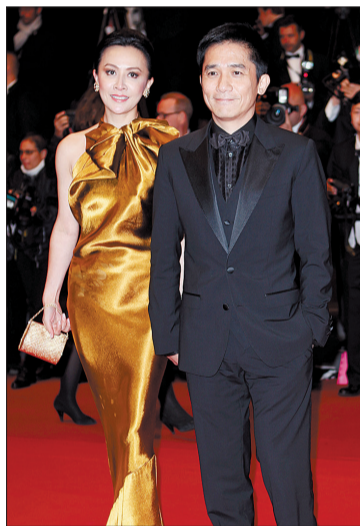
▲梁朝伟刘嘉玲夫妇特意来捧场 ▲张雨绮出席《天注定》首映式 (本版图片均据新华网)