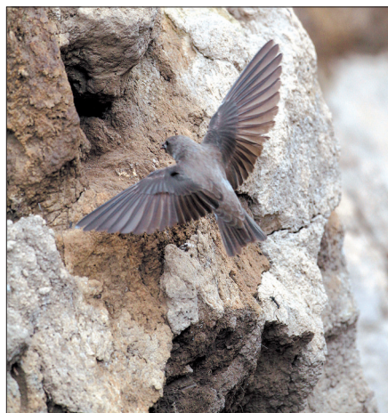
回家看看小宝宝,今儿个羽毛长了多少