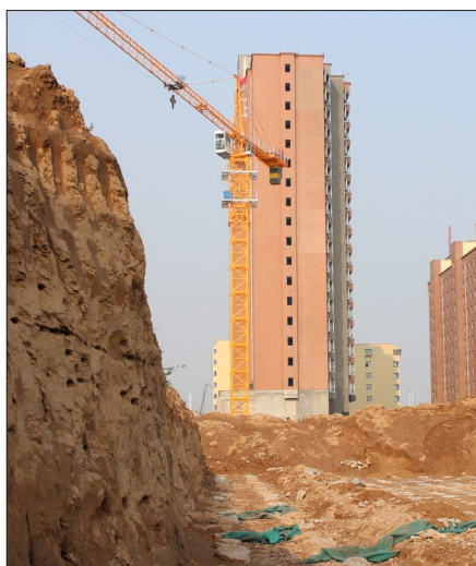
8号楼基坑边的土坡,深受燕子青睐