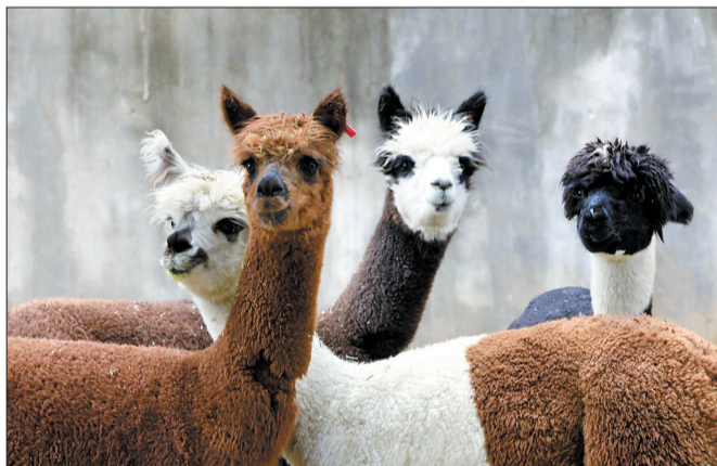
▲4只颜色各异的羊驼“呆萌呆萌”的