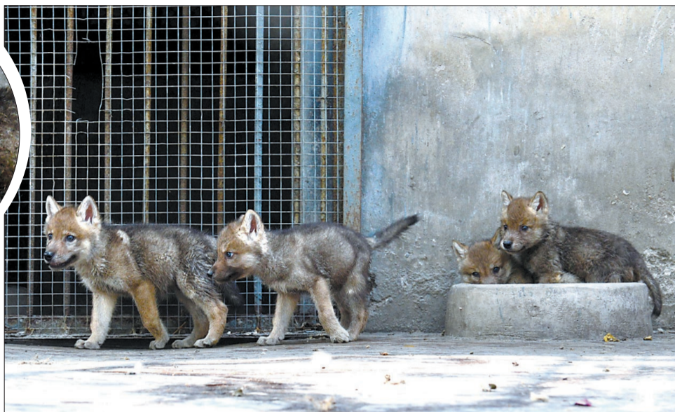
▲4只小狼可爱的模样吸引了不少读者为它们起名字

经主办方筛选、评定,手机尾号为“0161”的陈先生所起的一组名字中选。今后,您到王城公园看小狼,就能直呼其名:王子、城城、公主、园园。