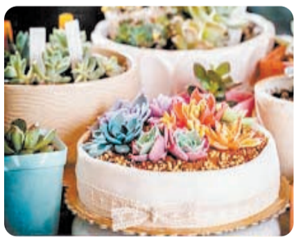
@福州日报:这是盆栽?不是,是蛋糕!