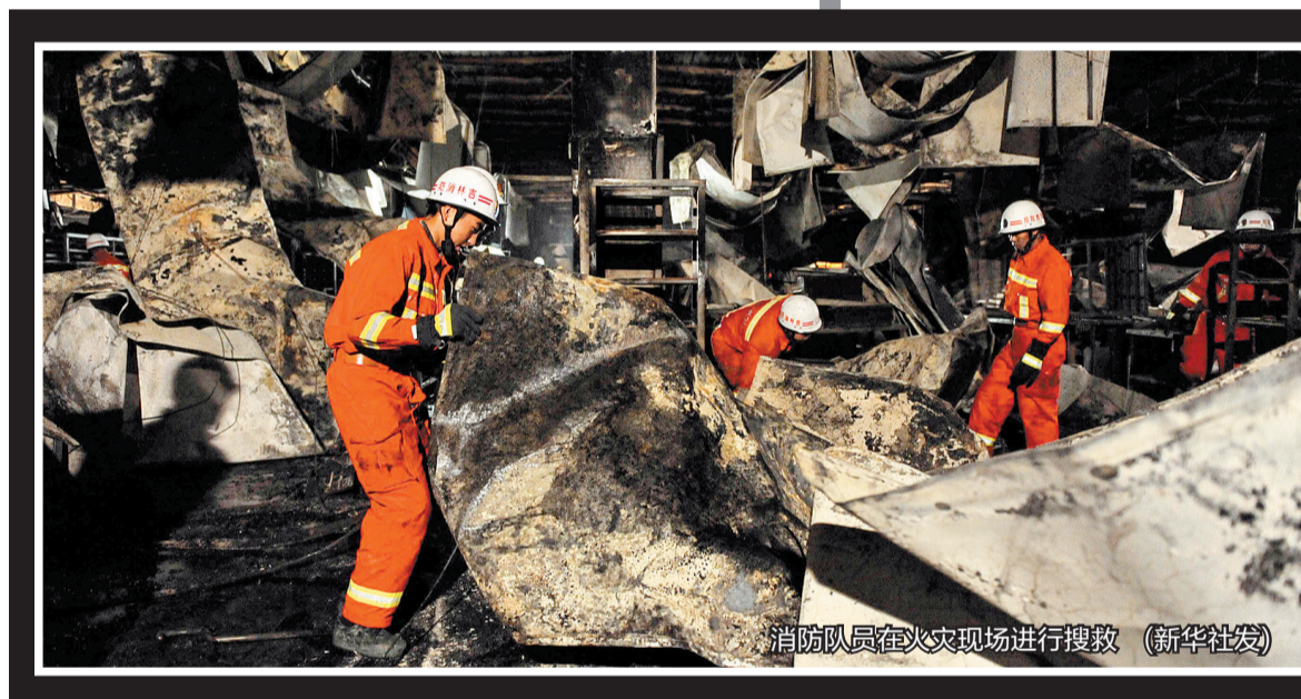
消防队员在火灾现场进行搜救

国务委员、国务院安委会副主任郭声琨代表党中央、国务院,率国务院有关部门负责人紧急赶赴事故现场指导救援工作。