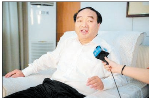
雷政富担任区委书记时接受采访,此时案件尚未曝光。