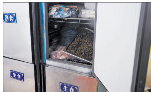
▲6月12日,徐福记总厂四楼食堂熟食柜里放着生肉 (新华社发) ◀事发公司(6月12日摄) (新华社发)