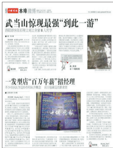
《十堰晚报》13日相关报道