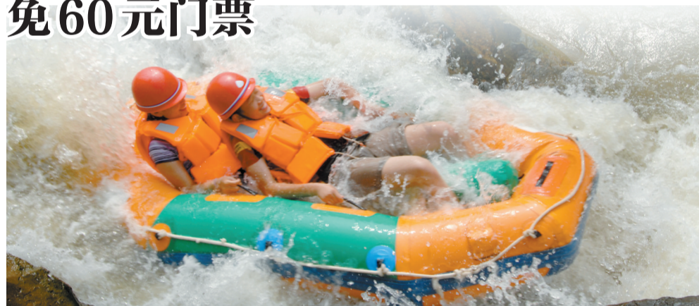
豫西大峡谷漂流实景图

玩漂流,就玩特色漂流;玩漂流,就玩天天不缺水的漂流。豫西大峡谷激情漂流邀你在今夏体验清凉与刺激。