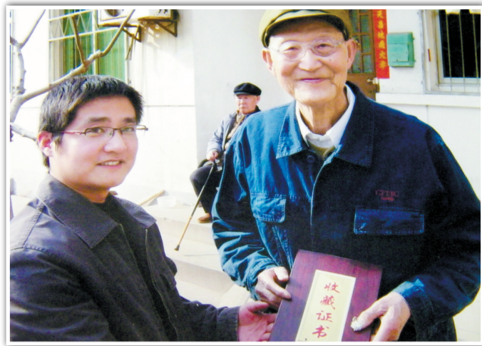
热心读者(右)向市图书馆捐书(资料图片)