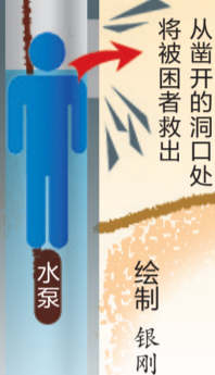
落井小伙等待救援

井直径只有约35厘米,下井救人、拴救生绳……这些方法都行不通 挖掘机挖深坑,消防队员在井壁上凿洞,众人用4个小时救出落井小伙