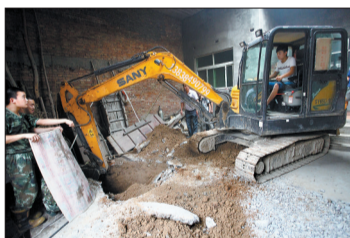
挖掘机操作者小心翼翼地挖土