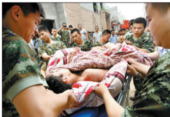
落井小伙被成功救出