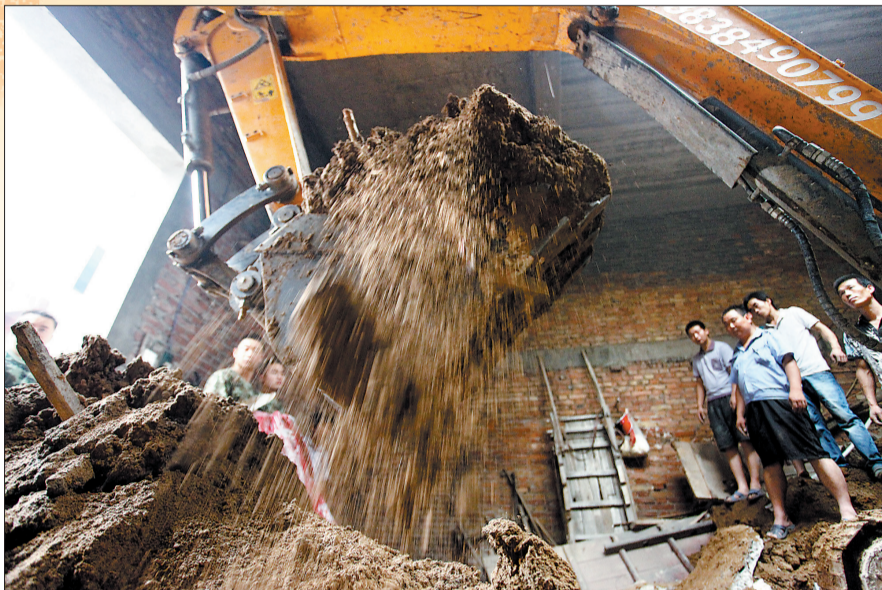
赶紧挖土,好早点救出落井者