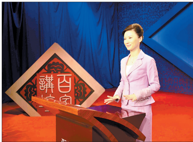
杨雨是央视《百家讲坛》栏目的著名主讲人之一