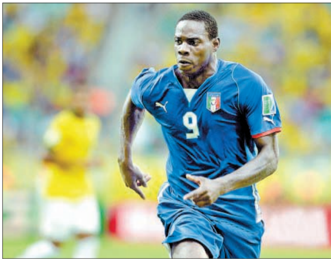
巴洛特利的存在令意大利队颇具锋芒

虽然一号指挥官皮尔洛因伤缺阵，二号指挥官蒙特利沃又因伤提前退场，但意大利中场阿奎拉尼昨日凌晨发挥出高水平，在指挥调度方面起到重要作用。“矮脚虎”贾凯里尼越