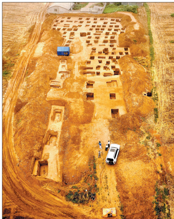
这是无人机在空中拍摄的发掘现场