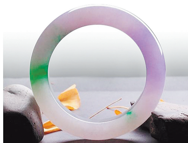
椿带彩翡翠手镯:水色交融翡翠好,绿色晶莹椿色俏。欲把翡翠比西子,浓妆淡抹总相宜。

的,铬(Cr 3+ )离子含量越高绿色越深,铬(Cr 3+ )离子含量达到极限就形成钠铬辉石(Na-CrSi 2 O 6 )矿物,也就是不透明艳绿色的干青翡翠。翡翠紫色的成因目前还没有定论,一般认为Mn替代硬玉中的Al形成这种颜色。黑色翡翠有三种:第一是硬玉质黑色翡翠(行业内称“黑乌鸡种翡翠”),这种黑色是由于后期渗入有机碳和金属成分而形成的,墨翠(绿辉石质翡翠)是由于含有绿辉石矿物而形成的,黑干青翡翠(钠铬辉石质翡翠)是由于含有钠铬辉石而形成的。