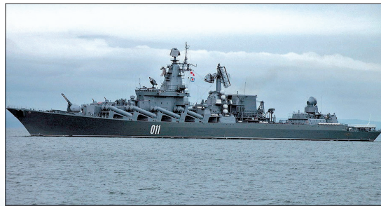
俄海军瓦良格号巡洋舰