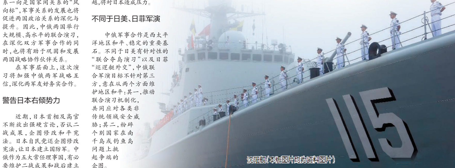
沈阳舰(本版图片均为资料图片)

隶属于南海舰队的武汉舰和兰州舰被誉为“中华神盾”,是由我国自主研发制造的第三代导弹驱逐舰,主要担负水面舰艇编队的区域防空和舰艇编队的作战指挥任务,曾多次圆满完成亚丁湾索马里护航任务。