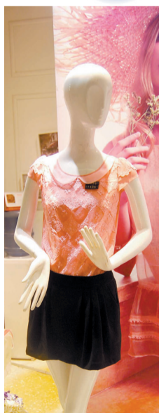
▲ 胭脂红色的上装搭配经典小黑裙，优雅别致