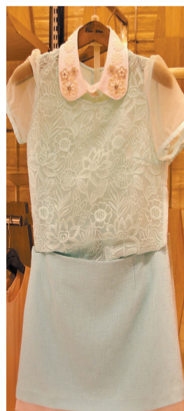
▲ 湖蓝色与薄荷绿色搭配，仿佛迎面吹来一股清新的风