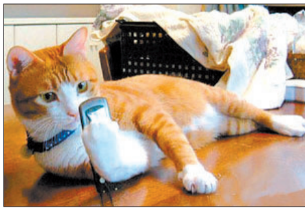
@猫扑:玩儿微博的标准姿势……