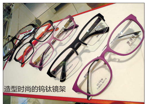
造型时尚的钨钛镜架

有些学生对眼镜有这样的认识误区:配镜后,只要不坏,就一副眼镜戴到底。业内人士提醒,配镜后,戴的人要定期进行视力复查,一般半年复查一次,如果视力减退,就要重新验光配镜。