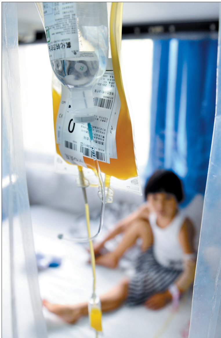
小嘉一及时输上了“救命血”