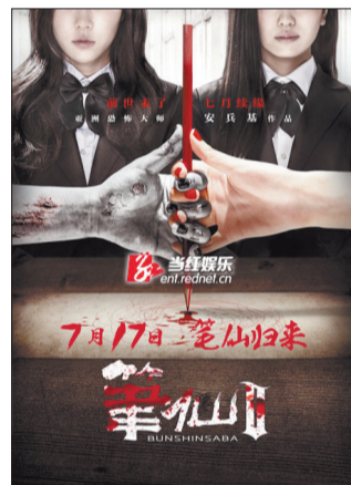
《笔仙2》海报

2012年《笔仙》因其细腻惊悚的设计和故事的起承转合，给观众留下了深刻印象。与前作相比，《笔仙2》的恐怖效果以及故事悬念都全面升