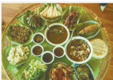
西双版纳:傣味拼盘