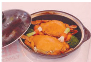
珠海:原汁蒸重壳蟹