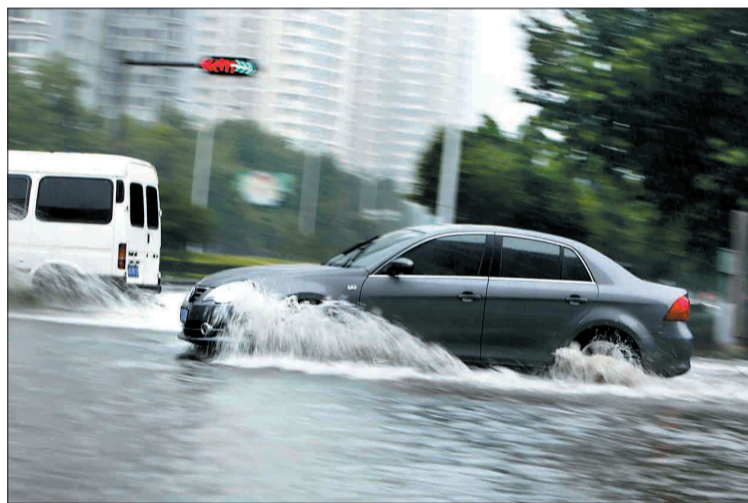
政和路与金城寨街交叉口昨天也积水了

我市已进入降雨集中期，请大家加强防汛工作，特别是加强危桥危路、险工险段、地质灾害易发点、危险水域沿岸等防汛工作；出行请带好雨具，若雨势较大，请避开容易积水的区域。