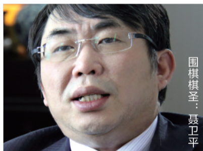
聂卫平 围棋棋圣：聂卫平 美丽岛老花镜，看远看近，只需一副，方便、舒适不用换，真好！

“我以前戴近视镜，现在眼睛老花，看远还好，看近的时候，比如看棋谱，就特别费劲，要不就得干脆换一副老花镜才行，这样戴上摘下的，非常不方便。戴上美丽岛眼镜后，这一切麻烦都没有了，不论是讲课、开会、作报告，还是看书下棋，只要戴一副就可以了，工作生活都非常方便，戴着也很舒适。”棋圣聂卫平戴美丽岛眼镜后倾情推荐。