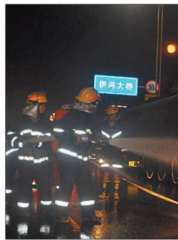
伊川消防队员连夜排险