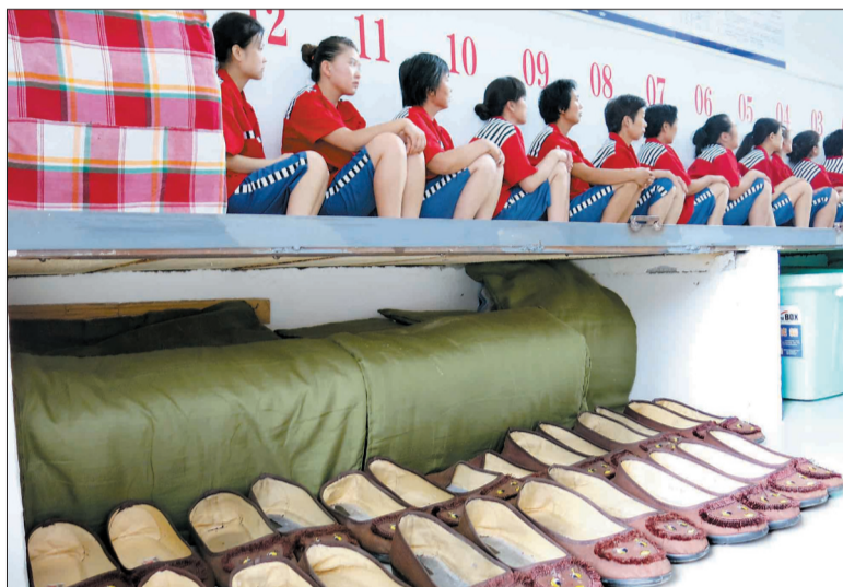
监室内,在押人员在集中收看电视节目